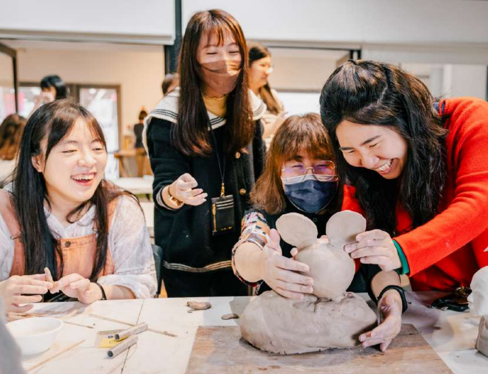
▲團體建立工作坊透過和藝術家共同創作，進一步建立團隊成員之間的凝聚和協作。