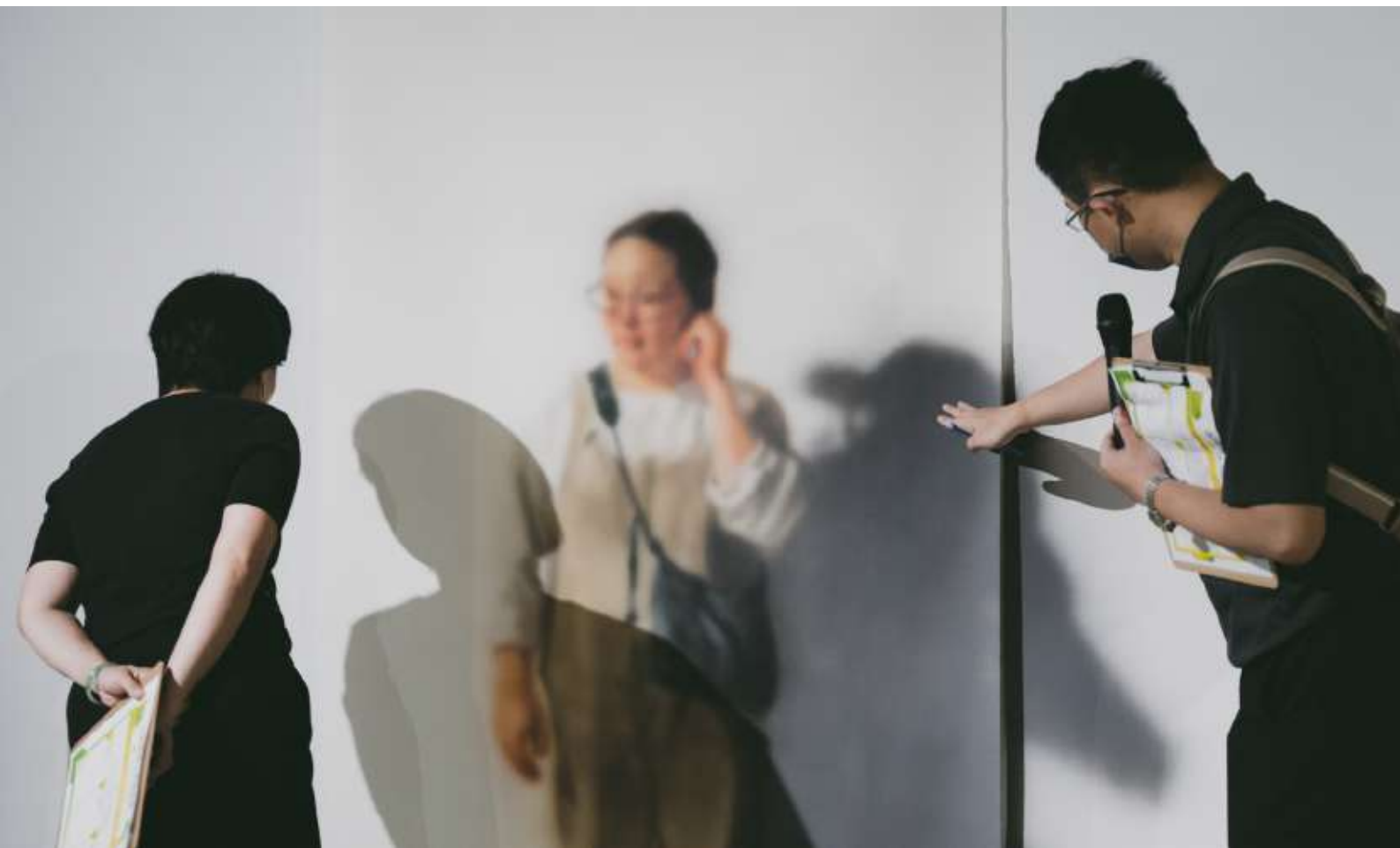
▲大眾對於《看他一臉扁平》展場作品提出個人觀看法。