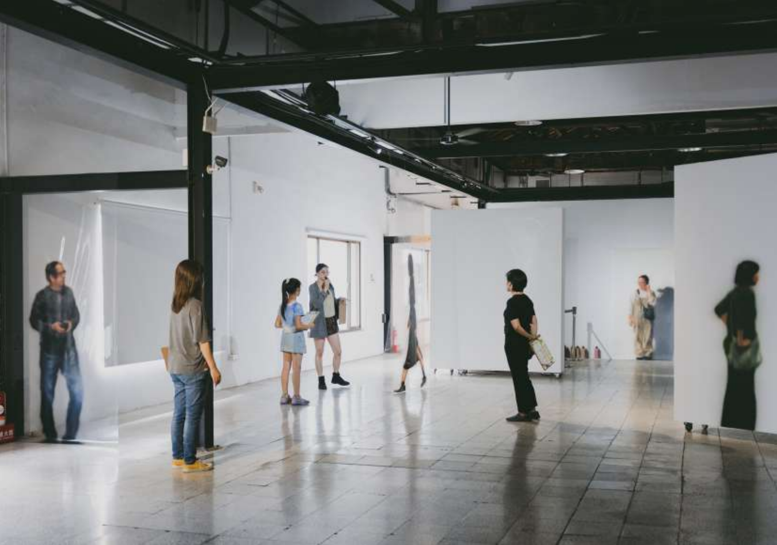
▲臺灣《看他一臉扁平》展覽現場。