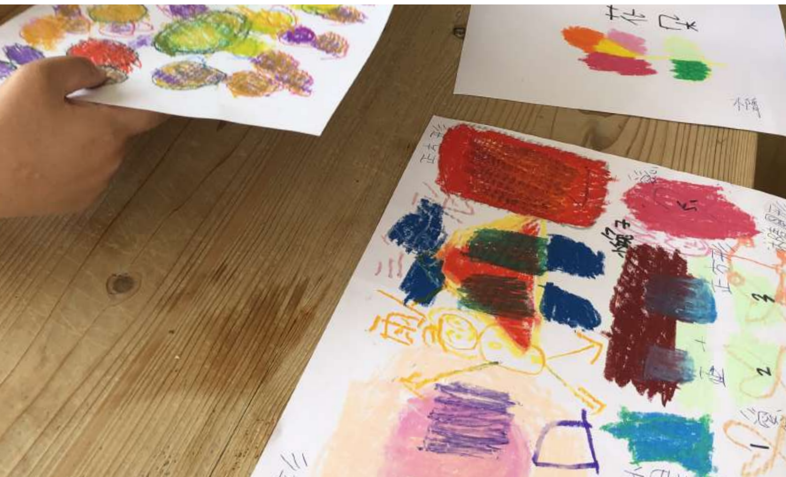
▲工作坊的現場，藝術家鼓勵學員不只是塗色，更嘗試讓色彩交疊，製作不同的色彩語彙。