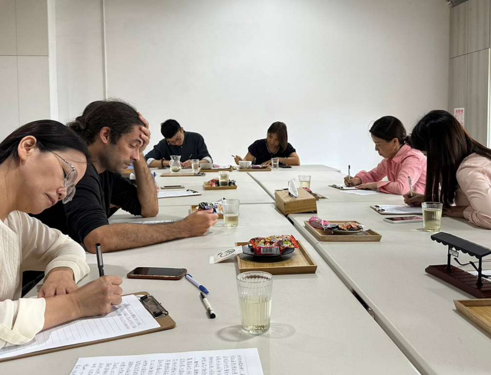
▲在藝術家的引導下，大眾一起動筆寫下搭乘火車、火車站候車的日常片刻。

以商業管理為探討主軸的「哈佛商業評論」國際中文版，則在2024年6月發表了一篇「你可以跟藝術家學到哪些事 What Can Business Learn from Art?」。文章中提到：「了解藝術創作的方式和原因，是一條通往成就 (accomplishment) 和精湛技藝 (mastery) 的道路——是的，連在企業界也是如此。」藝術家看似變魔術般或是難以理解的創作過程，其實也如同一般大眾的工作日常，需要經歷定義問題或是目標、反覆討論、實驗、修正錯誤，以及預算和時間的規劃。