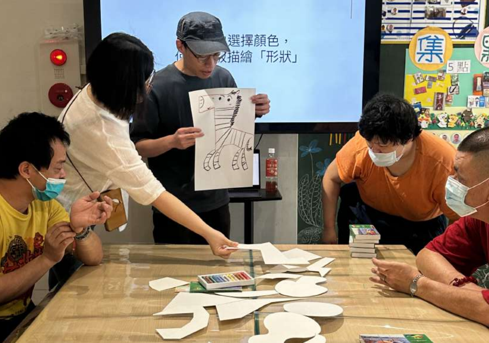
▲工作坊的現場，藝術家邀請學員一起透過形狀的組合，發揮想像力，創造出不同動物。